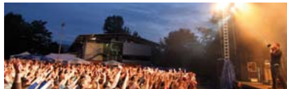
Open Air 2006: Tolle Atmosphäre an der Klostermauer in Söflingen

3. Open Air an der Klostermauer vom 26. bis 29. Juli mit Stars pur