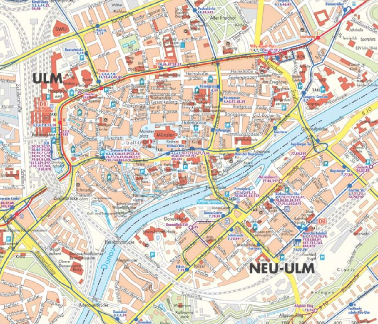
Abdruck der Pläne mit freundlicher Genehmigung des Herausgebers SWU Verkehr GmbH, Ulm © Digitale Kartografie Frank Ruppenthal, Karlsruhe