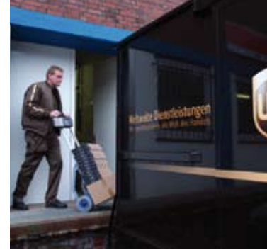
UPS: Unpassender Service

Warum sind UPS-Boten ohne Wechselgeld unterwegs?