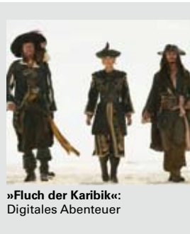
»Fluch der Karibik«: Digitales Abenteuer

Was läuft hinter den Kulissen eines Kinos ab? Wie sieht eigentlich ein Projektor aus, wie die moderne, digitale Version? Wie funktioniert die neuartige Digitalprojektion und wie unterscheidet sie sich von der klassischen Filmrolle? Begleiten Sie uns am Pfingstmontag, 28. Mai, zu einem exklusiven Besuch des Xinedomes. Nach der Begrüßung in der X-Lounge um 11 Uhr mit Prosecco und Butterbrezel, zeigen wir Ihnen den Xinedome und Sie können Fragen stellen. Um 12 Uhr besuchen Sie die Vorstellung des dritten Teils von »Fluch der Karibik«, der digital projiziert wird. Diese Veranstaltung ist auf 16 Plätze limitiert, die Teilnahmegebühr inkl. Snack und Film beträgt 6 Euro. Anmeldung unter stadtgespraeche@spazz-magazin.de .